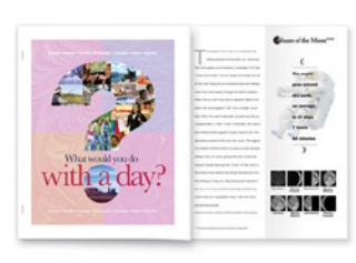
Inschietvellen in kleur, nieten en Engineering Z-vouwen

Met deze copier/printer kunt u meer doen. Ontwikkel innovatieve, werk-genererende toepassingen nu en in de toekomst.