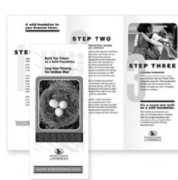
Dubbelvouwen, C-vouwen, Z-vouwen