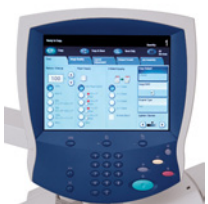
Geïntegreerde copier-/print server