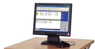
Xerox EX Print Server, met ondersteuning van Fiery