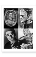
Squarefold Trim Booklet