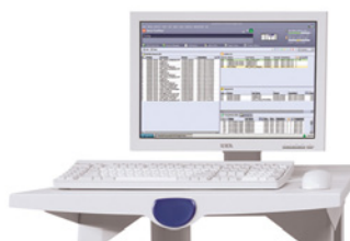
Xerox FreeFlow Print Server