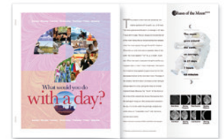
Inschietvellen in kleur, nieten en Engineering Z-vouwen