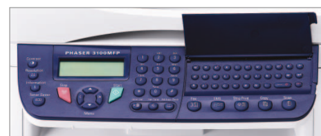
De Phaser 3100MFP/X komt met een volledig toetsenbord

Verbruiksartikelen voor de Phaser 3100MFP maken deel uit van het Xerox Green World Alliance Supplies Recycling Programme. Bezoek voor meer informatie de website van de Green World Alliance op www.xerox.com/gwa