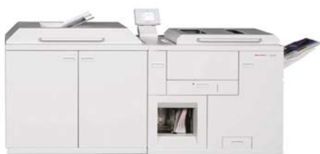
Horizon ColorWorks PRO Plus