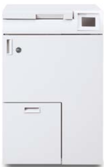
GBC® eBinder II™