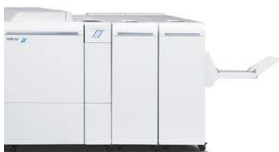
Plockmatic Pro 50/35™ Booklet Maker