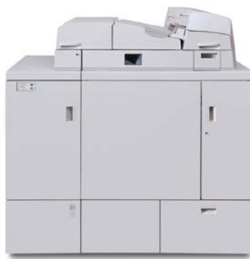
Xerox® Perfect Binder