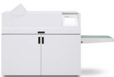
C.P. Bourg® BDFEx

De BDFEx wordt bediend via een touchscreen. Er zijn geen gereedschappen nodig om te wisselen van papierformaat of applicatie. Een systeem dat het volledige papiertraject bewaakt, zorgt ervoor dat elke stap van de documentproductie gecontroleerd wordt. Deze module bevat een eenvoudig te plaatsen, zelfrijgende draadhechtingscassette die automatisch meer dan 50.000 hechtingen produceert en zelfs ingesteld kan worden op verschillende boekdiktes. Andere functies zijn een dubbele rolvouwer voor scherpe, rechte en nauwkeurige vouwen en automatisch op maat maken met een zelfslipende snijder met twee messen.