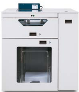
Xerox® inlegstation met twee modi (BSFEx) by C.P. Bourg®