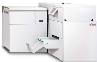
Watkiss PowerSquare™ 224