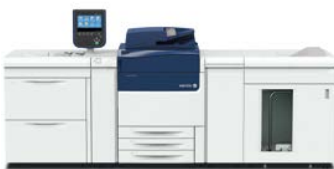
Xerox® Versant® 80-pers

U kunt uw oude pers ook inruilen voor een Xerox® Versant® 80-pers, Xerox® Versant® 2100-pers of Xerox® Colour 800i/1000i-persen voor consistent en betrouwbaar kleurbeheer. U zult snel en gemakkelijk uitstekende kleurkwaliteit bereiken, en zo opdracht na opdracht uw productiviteit en winstgevendheid verbeteren.