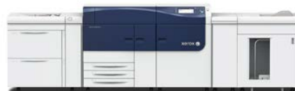
Xerox® Versant® 2100-pers