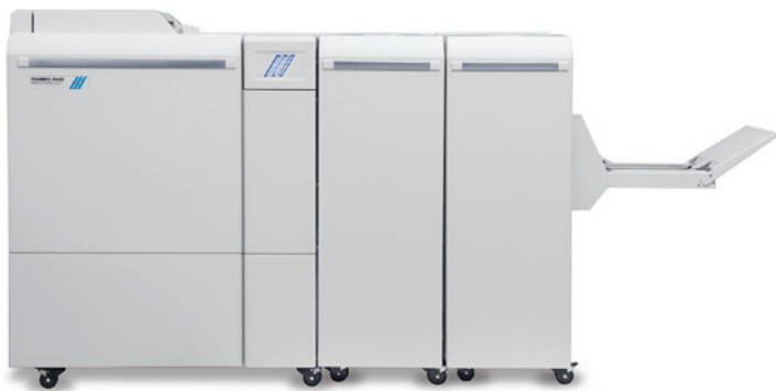
Plockmatic Pro 50/35 Booklet Maker, vervaardigd door Plockmatic International AB

De Plockmatic Pro 35 of Pro 50 Booklet Maker is de inline afwerkingsoptie die professionele gebruikers kiezen wanneer ze op de maximale snelheid van de gekoppelde productieprinter katernen van topkwaliteit nodig hebben – inclusief de optie om kleurenomlagen en kleurenpagina's toe te voegen. Vanwege het compacte ontwerp van de Pro 50/35's kunnen klanten zich beperken tot alleen die modules die ze voor hun toepassingen nodig hebben. Het apparaat kan ook offline worden gebruikt.