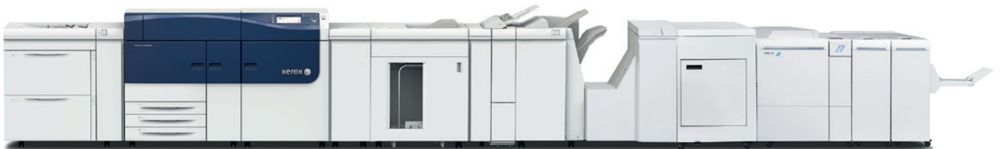
Xerox® Versant® 2100 pers getoond met Plockmatic Pro 50/35 Booklet Maker