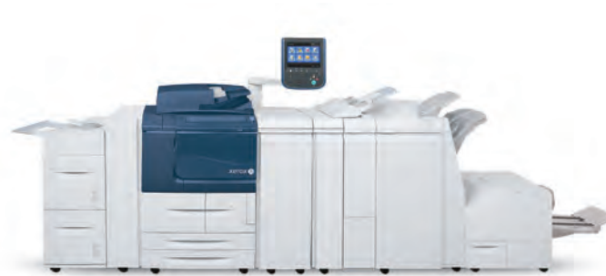
Xerox® D136 copier/printer met optionele inlegmodule met 2 inlegstations, standaardafwerking, vouweenheid en post-process invoegenheid.

Met innovatieve productieoplossingen wordt het milieu ontzien.