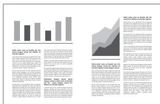
MS Outlook 1 zwart-witpagina met 2Up-printen