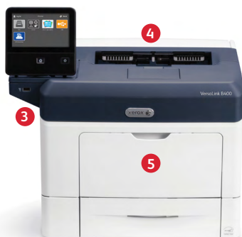
Xerox® VersaLink® B400 Printer Printen.

Deze ongeëvenaarde balans tussen hardwaretechnologie en softwarefunctionaliteit helpt iedereen die met de VersaLink® B400 printer of de VersaLink® B405 multifunctionele printer werkt, om in minder tijd meer werk gedaan te krijgen.